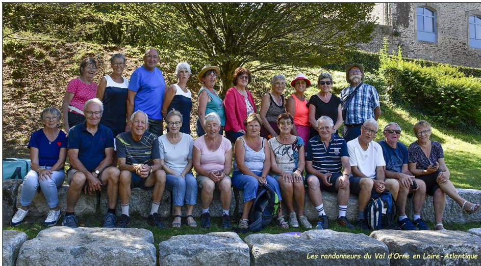
Les randonneurs du Val d'Orne en Loire-Atlantique