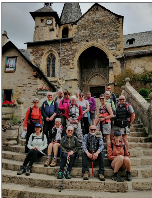
Devant l'église d'Estaing

Du 21 au 29 mai, 17 Randonneurs d'Andaine se sont posés dans un gîte fermier contemporain, à 1 100 m d'altitude, en Aveyron, aux confins du Cantal et de la Lozère.